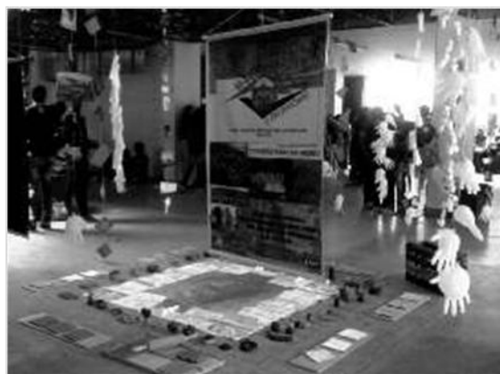
Figura 3: Semana de Apreciación, Valorización y Proyecto de Clausura - estrategias de preservación y de vivencia del patrimonio.

Cada momento de esta semana de apreciación ofreció una experiencia diferenciada para los aprendices. En las escuelas donde ellos eran estudiantes, la exposición despertó la curiosidad de los colegas que hacían las actividades llevadas a cabo y porque cada uno de ellos explicaron, generando admiración de todos. Además de ejercitar la creatividad de montaje de la exposición, se produjo una gran interacción entre compañeros y profesores promoviendo y difundiendo el reconocimiento de objetivos y valorización del patrimonio de la ciudad. Todo esto resultó en el aumento de la autoestima de la persona (estudiante, futuro guardián).