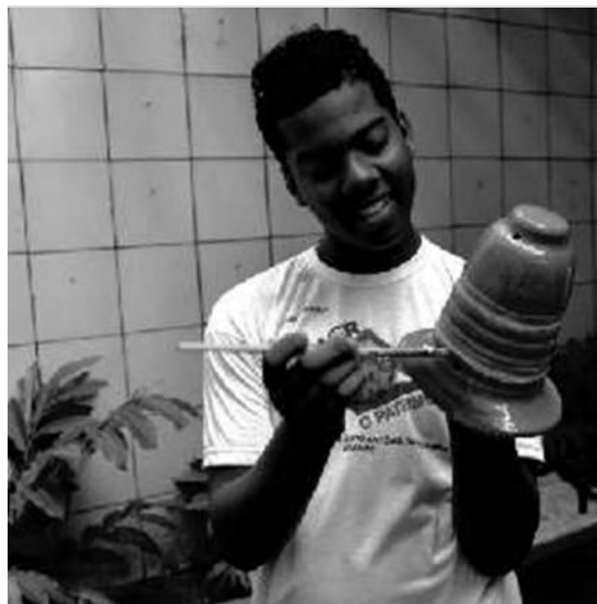
Figura 4: Los estudiantes en la actividad voluntaria a entrenar a su sala de estar, el colegio Mario Augusto Teixeira de Freitas, en Salvador.

En octubre de 2013, el tercer Congreso Iberoamericano y XI Jornada de Conservación y Restauración del Patrimonio Técnico, celebrado en La Plata, Argentina, sobresalió como artículo en la Formación de