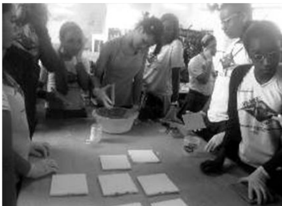
Figura 2: Actividades desarrolladas en el Proyecto.