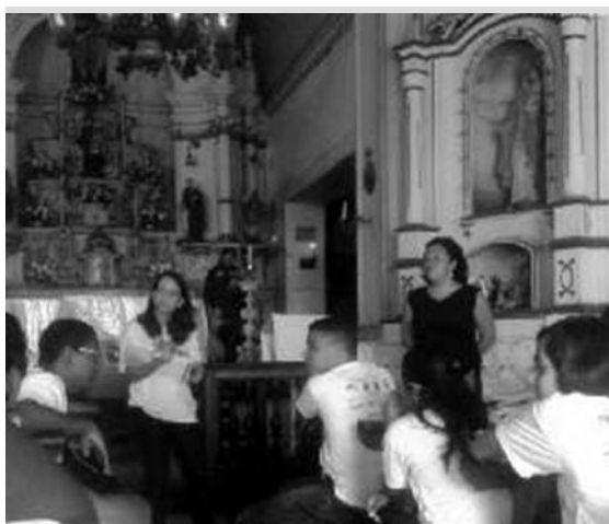
Figura 1: Los estudiantes conociendo y estudiando a la Iglesia para el inicio del registro manual.

Debido a la aptitud y el interés de los jóvenes para hacer frente a las nuevas tecnologías, se establecieron cinco disciplinas, que en conjunto se completaron diferentes conocimientos para atraer a los estudiantes a los flancos del patrimonio. De esa manera, se iniciaron como “Aprendices de las Técnicas de documentación para Patrimonio”, los cuales fueron, inclusive, certificados por la Facultad de arquitectura y reconocido como un curso de extensión por parte de la Universidad Federal de Bahía. Todo este conjunto de aulas tuvo ocho semanas de clases habiendo recibido 80 horas de capacitación, que se extendió por más de 90 horas debido a los visitantes de sorpresa para conferencias y exposiciones que despertaron la curiosidad y el interés de los estudiantes.