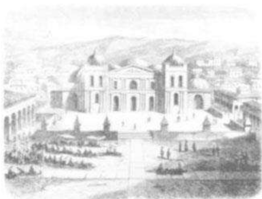
Plaza y Catedral del Cuzco