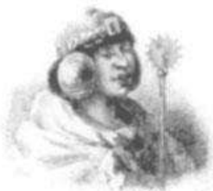
Inca Huiru Ccocha