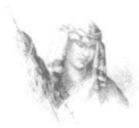
Coya Mama Ccahuana

Mayta Ccapac - Apu Condemayta - Orecó Huaranecu - Apo Jisac Condemayta - Conde Maucaylla - Mayta Purion - Ccayari Jahuaira - Pauca Jalli.