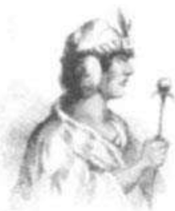
Inca Ccapac Yupanqui