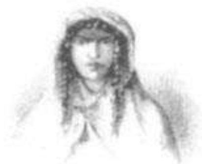
Coya Mama Michay Chimpu