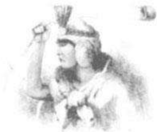
Inca Mayta Ccapac