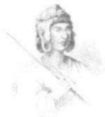
Inca Manco Capac