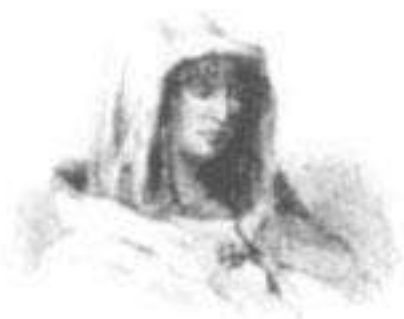
Coya Mama Anahuarqui

Yupanqui - Amaro Tupac Uturuncu - Achachi Sinchi Rocca - Apu Achachi - Apu Illaquita - Ina Iritu - Itupac Yupanqui - Huayna Atunqui Yupanqui - Jayan Achachi - Auqui Itupa - Ccacca Cuzco - Anahuarqui - Sahuaraura