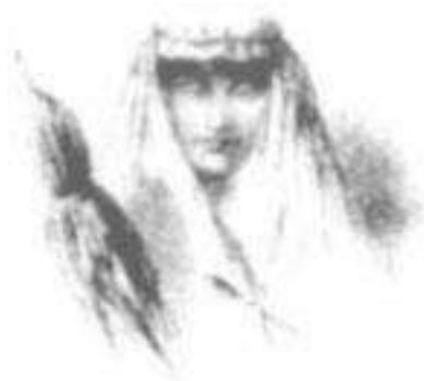
Coya Mama Cova Oello

Lloque Yupanqui - Auqui Allcay - Piñas Tuqa - Anta Ccahuncar - Rocca Yupanqui - Auqui Cchuma.