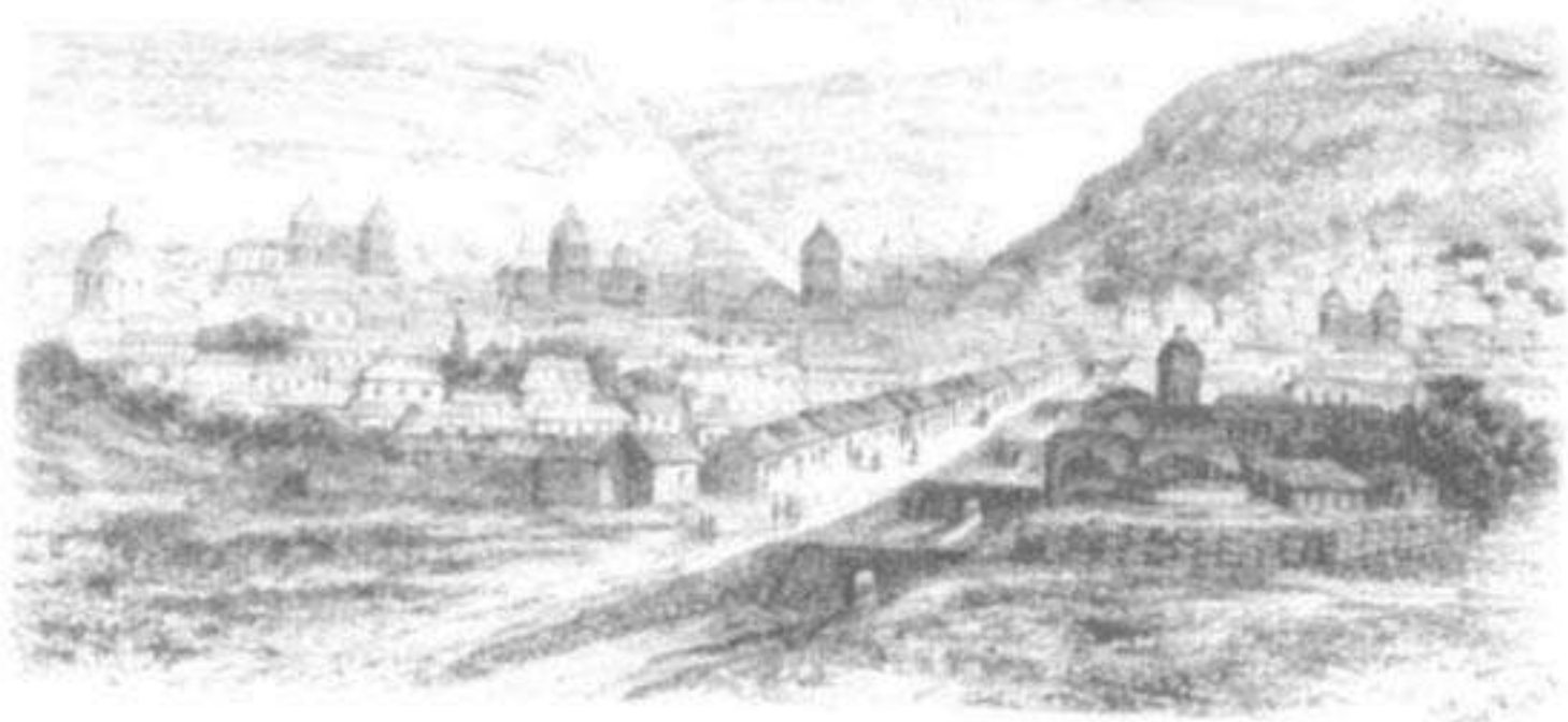
Vista general del Cuzco, desde Iscaypampa (luzera de la espina).