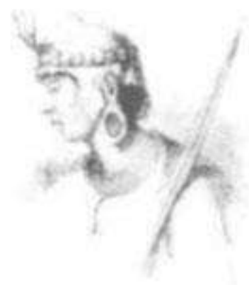
Inca Sinchi Rocca