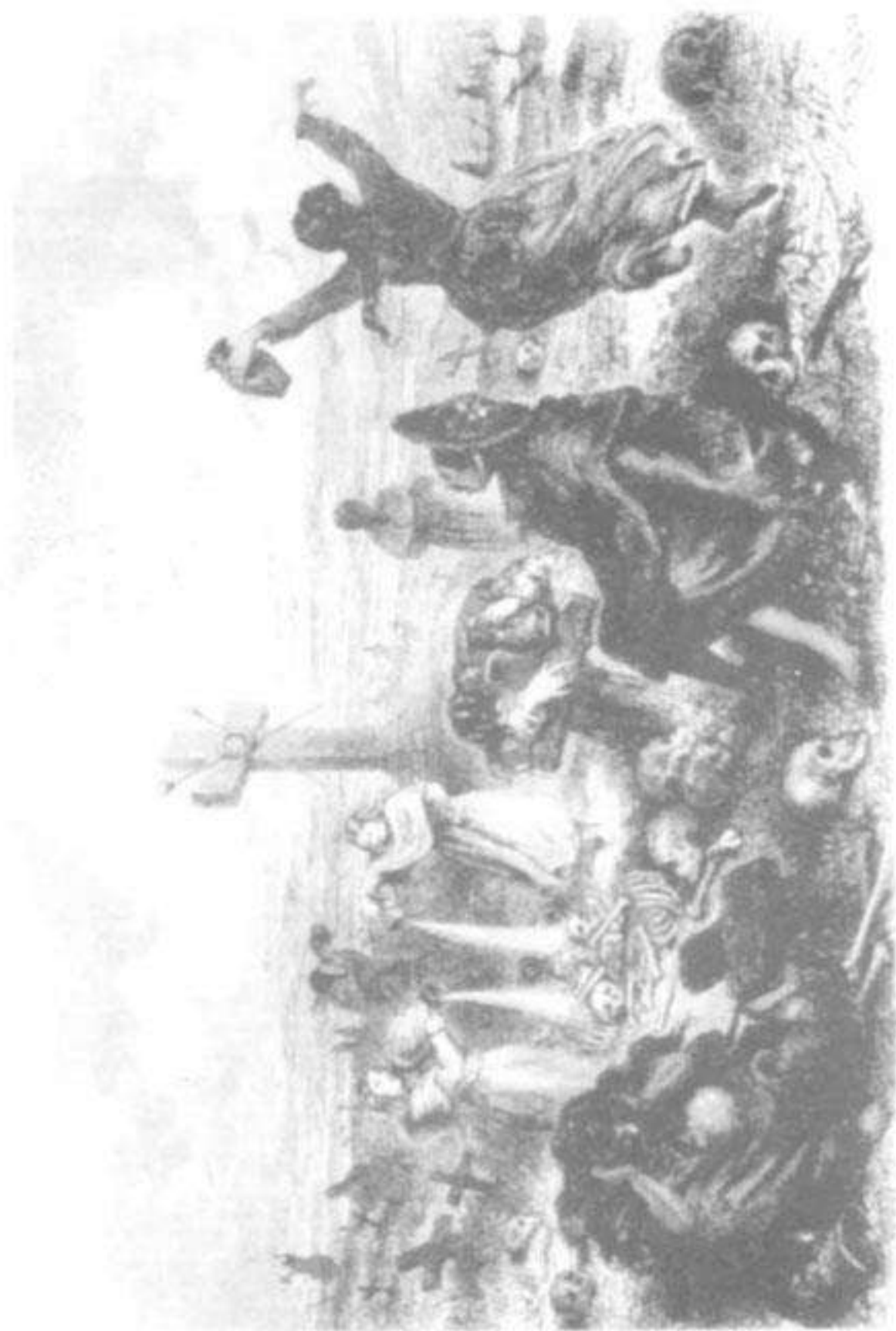
El día de los muertos en el Cuzco.