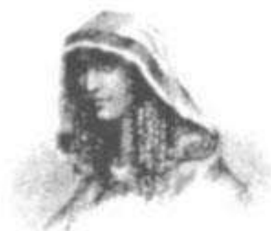
Coya Mama Curihillpa

Rocca - Auqui Apumayta - Apu Rimachi Mayta - Auqui Huayllacum - Curin Jahuayra - Pauca Jalli - Apu Quisquis.