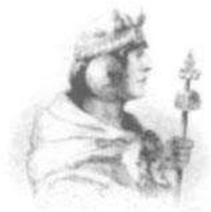
Inca Yahuar Huaccuc