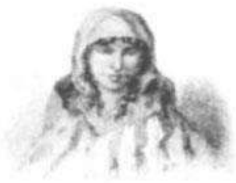
Coya Mama Runto