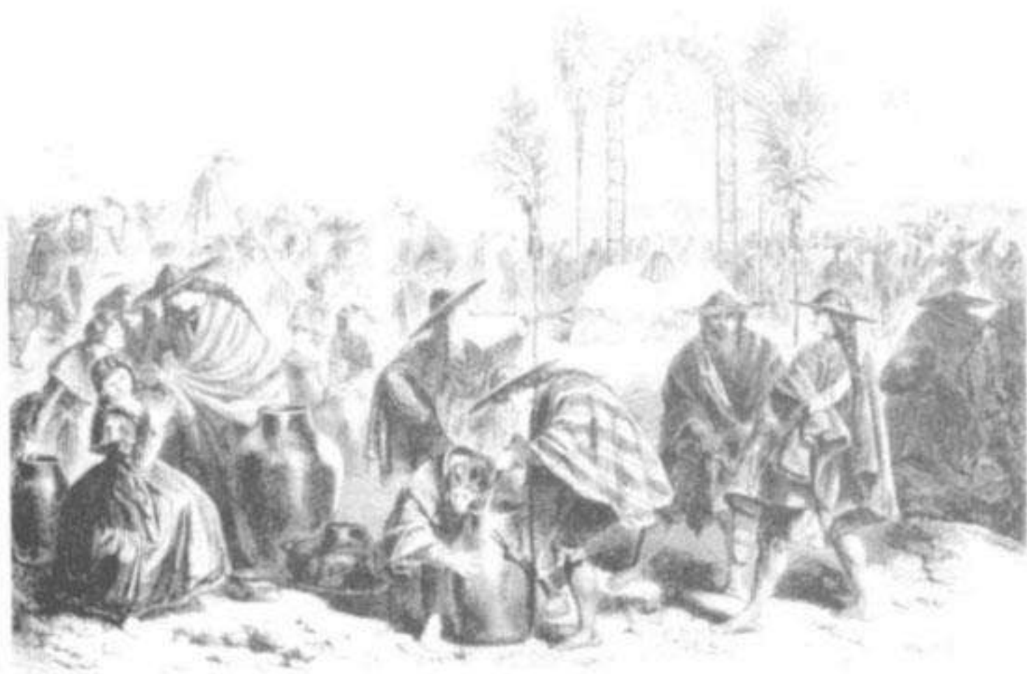
La fiesta de la Sangre de Jesucristo, en Punculbato.