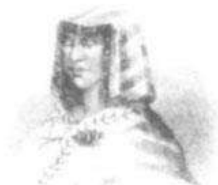
Coya Mama Cuca