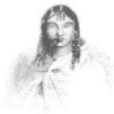
Coya Mama Choque Cchicysa Hillpai

Huiru Ccocha - Oresco Huarancca - Apu Marota - Auqui Mayta - Chima Chahuac - Sibi Rocca - Pahuac Chullimayta - Tupa Huamanchiri - Auqui Aucailli - Apu Hiqui Yupanqui - Auqui Cchara - Tupa Qqueso - Huaminirimachi - Atari Yupanqui - Cecollo Tupan Yupanqui - Auqui Ticsi Huatutopa - Panaca Chahomayta.