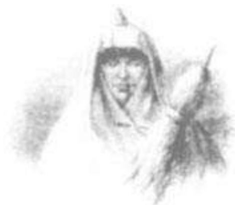
Coya Mama Oello Huacco