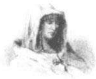
Coya Mama Anahuarqui

Yupanqui - Amaro Tupac - Uturuncu - Achachi Sinchi Rocca - Apu Achachi - Apu Illaquita - Ina Ina - Inpac - Yupanqui - Huayna Auqui - Yupanqui - Juyan Achachi - Auqui Inpa - Ceacca Ceozco - Anahuarqui - Saluarcaura