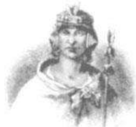
Inca Lloque Yaguarqui