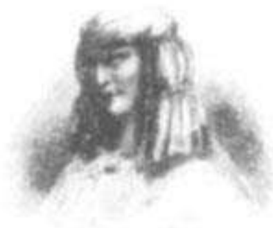
Coya Mama Chimo Oello