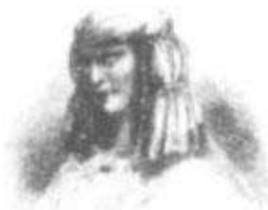
Coya Mama Chimpo Oello