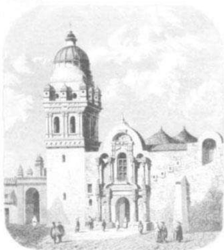
Iglesia de La Merced en el Cuzco.