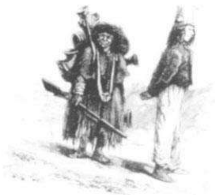
Soldado y rubona.