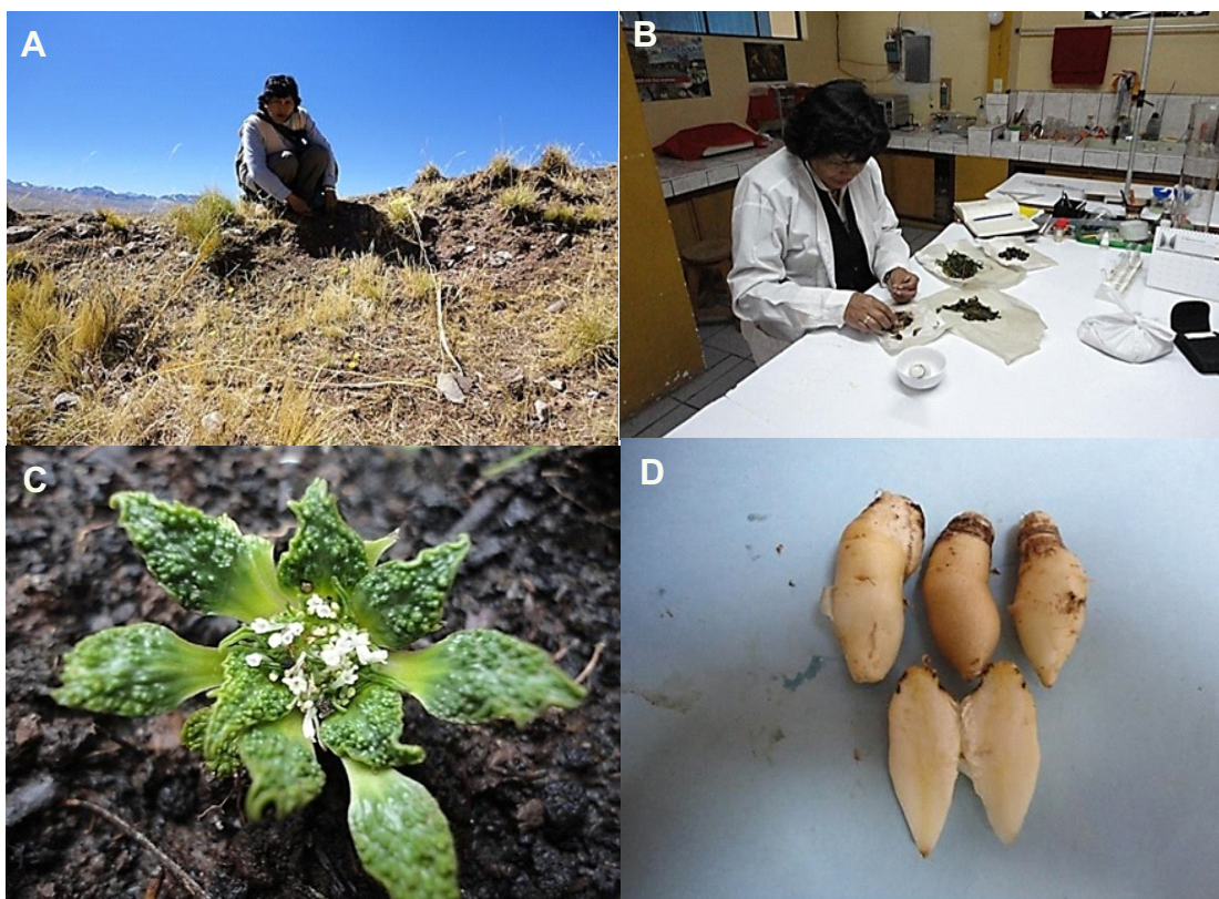
Figura 1. A. Sub parcela de la muestra evaluada, B. Análisis bromatológico de misq'i – pilli, C. En su hábitat; Stangea rhizantha y D. Colecta de raíz de chicuru.

En las áreas de estudio, se registró un total de 783 especímenes, de los cuales, la especie Stangea rhizantha predomina con 50.83% (398 muestras), en comparación con la especie Hypochoeris taraxacoides que posee el 49.16% (385 muestras), (Tab. 1).