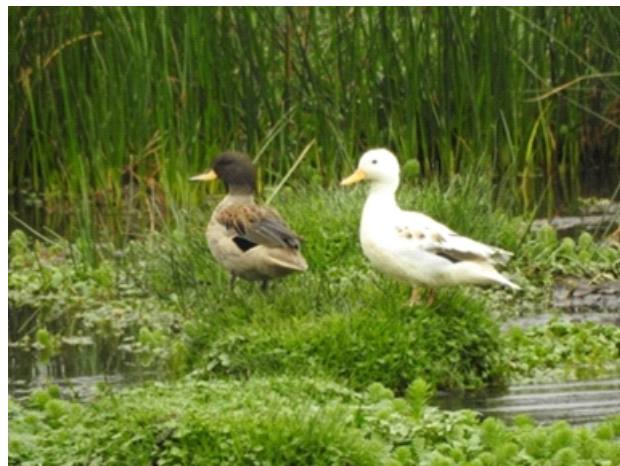
Figura 3. Individuo con Aberración INO, al lado de otro ejemplar con plumaje "normal". Cámara Nikon Coolpix P1000, con una apertura de f/8, tiempo de exposición de 1/500 segundos, ISO 400 y distancia focal de 539 mm

Se trata de la Aberración INO, y se basa en un único gen ligado al sexo en todas las especies y explicada como producto de una mutación recesiva que reduce la producción de eumelanina y phaeomelanina, pues por definición, presentan un plumaje muy pálido (casi blanco), que en los adultos se tornan más blanco debido al blanqueamiento por la luz solar, la herencia de Ino (tanto la forma clara como la oscura) es recesiva y ligada al sexo, por lo que solo se encontrarán hembras en estado silvestre. Sin embargo, la descendencia Ino siempre es hembra y los machos Ino solo pueden ser producto de una hembra con la mutación emparejada con un macho heterocigoto. La decoloración en los pigmentos de melanina, en donde la phaeomelanina es casi ausente y poco menos la eumelanina en el plumaje, los colores café oscuro se aclaran. Difiere del leucismo en que la base de las plumas mantiene su coloración original, debido a la exposición solar. Se recomienda el monitoreo continuo del individuo para registro de nueva muda y para evitar la confusión en la identificación (van Grouw, 2006; 2013; 2018; 2022; Sovrano et al. 2016; Rodríguez-Ruíz et al. 2017). (Fig. 3)