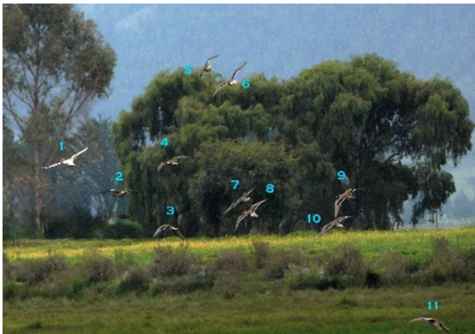
Figura 7. Registro de la parvada de los 11 ejemplares. Apertura de f/5, velocidad de 1/800 segundos, ISO 100 y distancia focal de 126 mm, equivalente a 700 mm en formato de 35 mm. La imagen conserva una resolución de 4608 × 3456 píxeles

En el primer caso, del ejemplar del Humedal Lucre–Huacarpay, corresponde a una Aberración INO, y en el segundo caso, el ejemplar del Humedal Yungaqui, a una Aberración Dilución Pastel. Los riesgos ambientales en este tipo de aberraciones son muy controversiales, en el tiempo de seguimiento empleado, no se pudo comprobar ni negar, que puedan darse en esta especie.