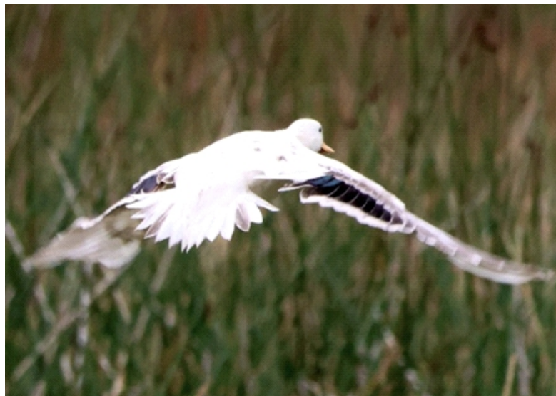
Figura 4. Ejemplar con Aberración INO. Cámara Nikon Coolpix P1000, con una apertura de f/8, tiempo de exposición de 1/500 segundos, ISO 400 y distancia focal de 539 mm.

Corresponde a la Aberración Dilución Pastel, son la versión pálida de individuos con plumajes normales, ocurre cuando hay una reducción cuantitativa de ambas melaninas (eumelanina y feomelanina) y por lo cual las plumas negras se tornan grises y las pardo rojizas se vuelven pardo amarillentas, además, al igual que en otras alteraciones sobre la cantidad de melanina, las plumas se blanquean por acción de la luz solar, pues trata sobre las coloraciones negras, marrones o grises oscuras que se aclaran o diluyen a grises y rojizos hasta amarillentos o beige. (Van Grouw, 2013; Cadena et al. 2015; Rodríguez-Ruíz et al. 2017 y Tinajero, 2018). (Fig.5 y 6)